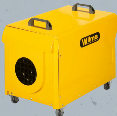
Abbildung EL 4, EL 18 ähnlich