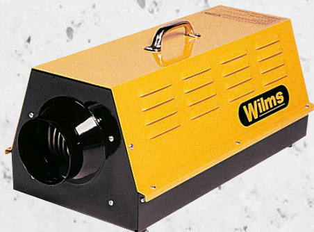
Abbildung EL 15 ähnlich